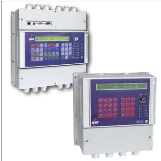
Maximumüberwachungssystem EMOS5 und ESM5