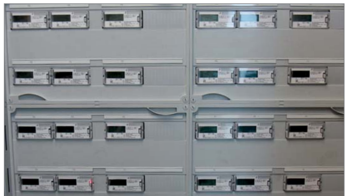
Drehstromzähler DHZ+ im Einsatz im Stiftungsdorf Walle, auf den Grundmauern des Waller Wasserturms errichtet und seit Januar 2018 bezugsfertig.