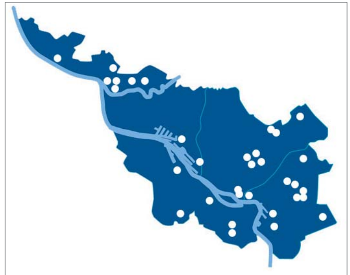
Wohn- und Pflegeheime der Bremer Heimstiftung sind mittlerweile an 32 Standorten in Bremen in Betrieb.